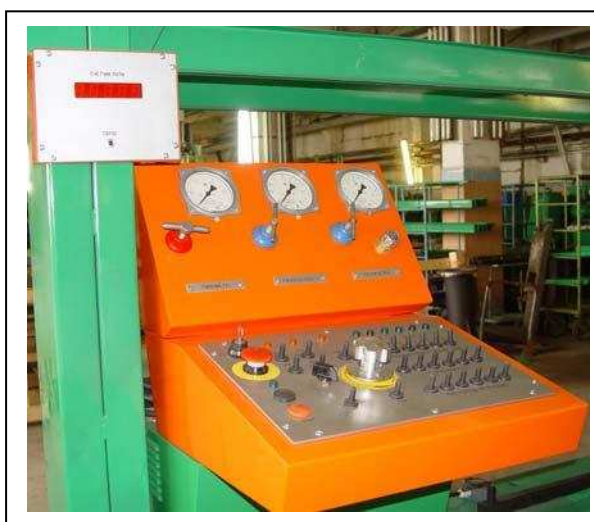
Пульт оператора раскройной машины

Машины термической резки (МТР) серии «Комета М-КЛ» предназначены для прямолинейного раскроя листового металлопроката. Машины портального типа выпускаются с газокислородной (К) технологической режущей оснасткой. Применяются в основном на ЗМК и мостостроительных предприятиях. Обычно имеют 6-8 раскройных суппортов, с возможностью взаимной фиксации на расстоянии, определяющем ширину вырезаемой полосы. Также машина может быть снабжена специальным, независимым суппортом с резакром для поперечной отрезки.