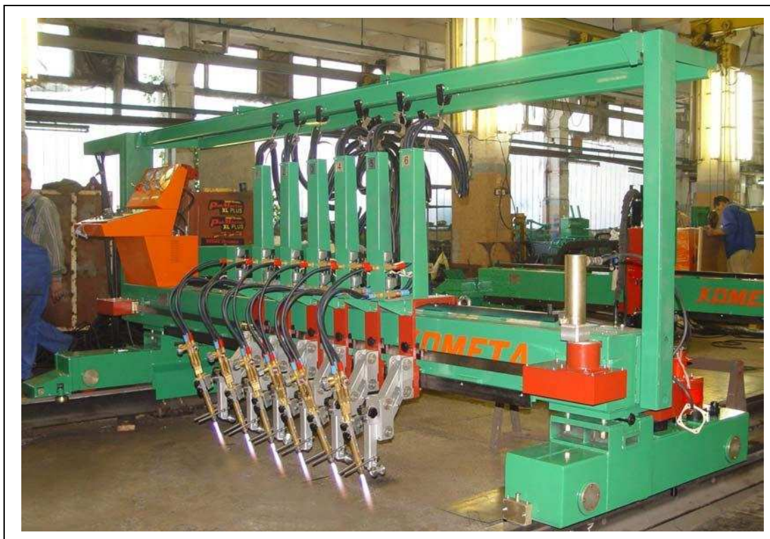
«Комета М-Кл» на испытаниях

Машины термической резки (МТР) серии «Комета М-КЛ» предназначены для прямолинейного раскроя листового металлопроката. Машины портального типа выпускаются с газокислородной (К) технологической режущей оснасткой. Применяются в основном на ЗМК и мостостроительных предприятиях. Обычно имеют 6-8 раскройных суппортов, с возможностью взаимной фиксации на расстоянии, определяющем ширину вырезаемой полосы. Также машина может быть снабжена специальным, независимым суппортом с резакром для поперечной отрезки.